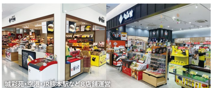
城彩苑・空港・JR熊本駅など8店舗運営