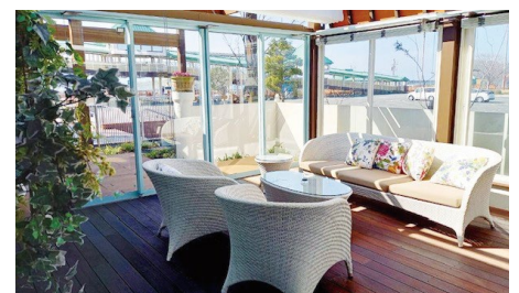
港カフェオープンデッキ