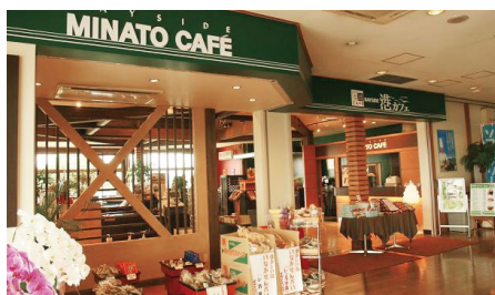
ベイサイド港カフェ (熊本港フェリーターミナル内)