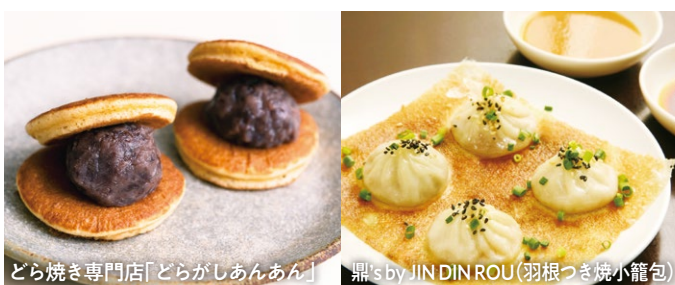
どら焼き専門店「どらがしあんあん」