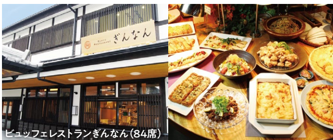
ビュッフェレストランぎんなん(84席)