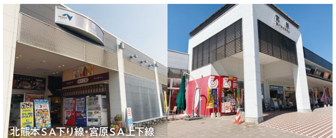
北熊本SAT下り線・宮原SA上下線