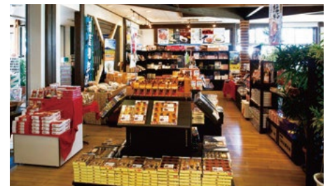
みやげもん (熊本港フェリーターミナル内)